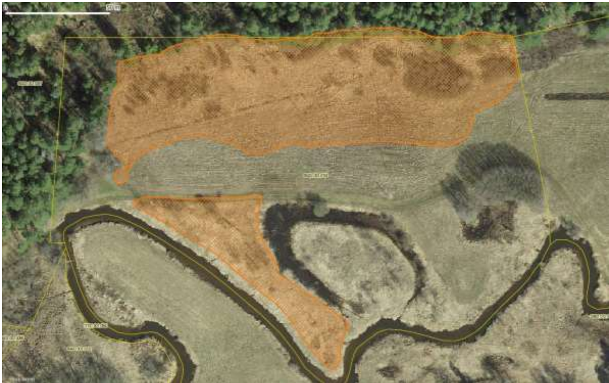
Joonis 2. Oranžiga viirutatud tööala id 9899 – kändude ja mätaste freesimine